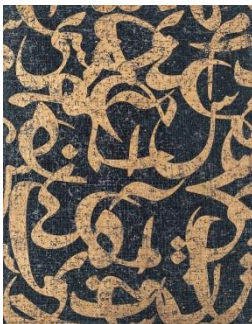
Farhad Moshiri (1963 Shiraz - lives and works between Tehran and Paris) Y84M 2006 Acrylic and Gold paint on canvas 190 x 150 cm MAT.2015.4.1

علي حسن (١٩٥٦ الدوحة - يقيم ويعمل في الدوحة) نون ١٩٩٦ ألوان الأكريليك على ورق ٧٥ x ١١٠ سم MAT.2007.1.1788