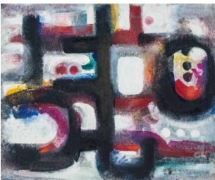
Ahmed Cherkaoui (1934 Boujad - 1967 Casablanca) Talisman Rouge 1967 Oil on canvas 81 x 100 cm MAT.2013.13.25

أحمد الشرقاوي (١٩٣٤ بوجعد - ١٩٦٧ الدار البيضاء) الأخوات الثلاث ١٩٦٣ ألوان زيتية على قماش ١٥٢ x ١٣٠ سم MAT.2015.22.5