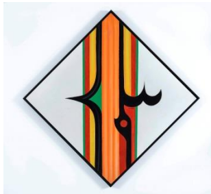
Rafa al-Nasiri (1940 Baghdad - 2013 Amman) Untitled 1971 Acrylic on plywood 100 x 100.5 cm MAT.2011.14.11

رافع الناصري (١٩٤٠ بغداد - ٢٠١٣ عمان) في أعماق الغربة ١٩٧٢ ألوان الأكريليك على خشب رقائقي ٩٠ x ٩٠ سم MAT.2011.14.10